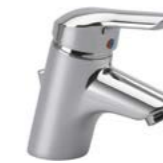
MITIGEUR LAVABO MONOTROU OKYRIS PRO

Bec fixe avec aérateur cascade intégré. Cartouche Ø 47 mm à 2 disques céramique avec limiteur de température intégré et limiteur de débit 50% déverrouillable. Flexibles d'alimentation 350 mm. Système Easy Fix. Hauteur : sous aérateur 48 mm - totale 132 mm. Projection : 109 mm.