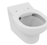
CUVETTE ENFANT SUSPENDUE CONTOUR 21 53,5 x 36 x 35 cm

En porcelaine vitrifiée. Sans bride avec trous d'abattant. Fonctionne sur chasse directe ou sur bâti support. Plaque arrière surélevée anti infiltration. Fonctionne à 4,5 litres.