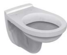
CUVETTE SUSPENDUE ULYSSE 52 x 36 cm

*Coloris au choix : blanc (01), bleu (36), jaune (79), rouge (GQ)