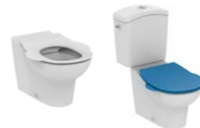
CUVETTE ENFANT INDÉPENDANTE CONTOUR 21 49 x 31,5 cm - hauteur : assise 30,5 cm totale 36 cm

En porcelaine vitrifiée. Sans bride avec trous d'abattant. Assise ergonomique à bord rond sans trou d'abattant. Sortie horizontale Ø 102 mm. Plaque arrière surélevée. Fonctionne à 4,5 litres. Fixation au sol par 2 vis. Installation avec réservoir S327001 ou alimentation indépendante.