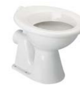
CUVETTE INDÉPENDANTE ESCULAPE 52,5 x 38 cm - hauteur totale 41 cm

En porcelaine vitrifiée. Bride ouverte. Assise ergonomique, sans trou d'abattant. Sortie horizontale Ø 102 mm. Alimentation par chasse directe ou réservoir surélévé. Fonctionne à partir de 6 litres. Fixation au sol par 4 vis verticales NF/EN997 Classe 1.