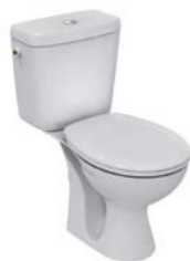
ENSEMBLE WC ULYSSE Dimensions de l'ensemble : 67,5 x 38,5 cm

Cuvette et réservoir (livré équipé et monté). En porcelaine vitrifiée.