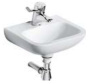
LAVE-MAINS MATURA 2 37 x 30,5 cm

En porcelaine vitrifiée, sans trop plein. Compact et caréné. Autoportant, percé 1 trou central pour la robinetterie.