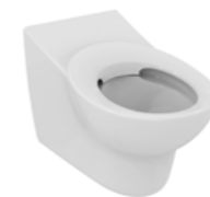
CUVETTE ENFANT SUSPENDUE CONTOUR 21 49 x 31,5 x 35,5 cm

En porcelaine vitrifiée. Assise ergonomique à bord arrondi. Sans bride sans trous d'abattant. Fonctionne sur chasse directe ou sur bâti support. Plaque arrière surélevée anti infiltration. Fonctionne à 4,5 litres.