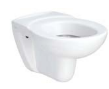
CUVETTE SUSPENDUE ESCULAPE 54,4 x 36,1 cm

En porcelaine vitrifiée. Assise ergonomique. Bride ouverte sans trous d'abattant. Fixation par tire-fond ou sur bâti support. Plaque arrière surélevée anti infiltration NF EN997 Classe 1.