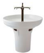
LAVABO CIRCULAIRE Ø 95 cm

En céramique, sans trop plein. Installation en îlot sur pied de 80 cm P198001 ou 50 cm P200201. À équiper d'une colonne de robinetterie livrée avec 6 becs D0074AA et robinet central temporisé ou colonne livrée nue à équiper de robinetteries D0075AA.