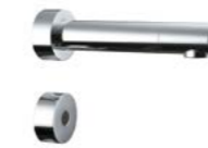
BECS LAVABO MURAL À DÉTECTION ÉLECTRONIQUE SÉPARÉE OKYRIS 2 CLINIC

Avec cellule de détection séparée du bec (de 80 à 120 mm). À équiper d'un boîtier électronique piles ou secteur. Bec fondu fixe monofluide avec brise-jet étoilé antibactérien et anticalcaire. Distance de détection pré-réglée à 147 mm, réglable manuellement de 50 à 250 mm. Mode de fonctionnement pré-réglé "lave-mains" modifiable avec télécommande en option. Fonctions : rinçage automatique, désinfection et nettoyage programmables avec la télécommande en option. Sécurité : arrêt de l'écoulement après 55 secondes. Boîtier électronique au choix : piles ou secteur (en option). Débit : 9 l/mn sous 3 bars.