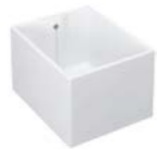
CUVE DE LABORATOIRE FACULTE 60 x 50 x Haut. 38 cm

En grès, à poser, avec trop plein. Livrée avec bonde et siphon réf.D5887AA.