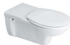
CUVETTE SUSPENDUE RALLONGÉE MATURA 70 x 35,5 cm

Adaptée au transfert des personnes à mobilité réduite PMR. En porcelaine vitrifiée, bride ouverte. Assise ergonomique. Fixation par tire-fond ou sur bâti support. Plaque arrière surélevée anti infiltration. À équiper d'une manchette d'alimentation rallongée 40 cm recoupable D90A267NU et d'un joint Sirius.