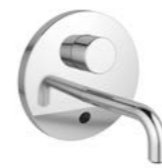
THERMOSTATIQUE LAVABO ENCASTRÉ OKYRIS ÉLECTRONIQUE

Thermostatique électronique à encastrer monofluide avec bec et cellule de détection intégrée sur la plaque. Bec fondu avec brise jet étoilé antibactérien et anticalcaire. Réglage de la température avec outil dédié. Résiste aux chocs thermiques jusqu'à 80° C pendant 60 mn. Sécurité coupure de l'écoulement en cas de coupure de l'eau froide conformément à la norme NF 1111. Clapets anti-retours intégrés. À intégrer dans boîte à encastrer réf. A1000NU.