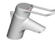
MITIGEUR LAVABO MONOTROU OKYRIS 2 CLINIC

Bec fondu fixe avec jet incliné. Manette métal longue ajourée 140 mm par vis pointeau anti-desserrage et isolateur thermique. Brise jet anti-bactérien et anticalcaire fourni. Cartouche Ø 47 mm à 2 disques céramique avec limiteur de température intégré et limiteur de débit 50% déverrouillable. Résiste aux chocs thermiques jusqu'à 80° C pendant 60 mn. Flexibles d'alimentation 350 mm. Système Easy Fix. Hauteur : sous aérateur 48 mm - totale 132 mm. Projection : 109 mm.