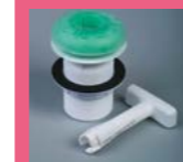
NOUVEL URINOIR SANS EAU AXIF PLUS

RÉF. S6494AC 77,20 € RÉF. S649436 77,20 € RÉF. S6494LJ 77,20 € Coloris au choix : blanc (AC), bleu (36), gris (LJ)