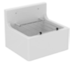
POSTE D'EAU SERVICE 46 x 38 cm

En céramique. Grille porte seau fournie. Fixation sur consoles D5705AC ou sur pieds S9233MY pour une plus grande robustesse.