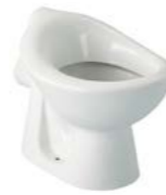
CUVETTE BÉBÉ INDÉPENDANTE CRÈCHE 38 x 27 cm - hauteur : assise 24,5 cm totale 31 cm

En porcelaine vitrifiée. Bride ouverte. Assise ergonomique à bord rond sans trou d'abattant. Sortie horizontale. Sans réservoir, alimentation indépendante. Fonctionne à 4,5 litres. Fixation au sol par 2 vis verticales. Hauteur d'installation maxi du réservoir 84 cm. En cas d'installation avec le réservoir haut P922001 prévoir le tube de chasse D5995AC.